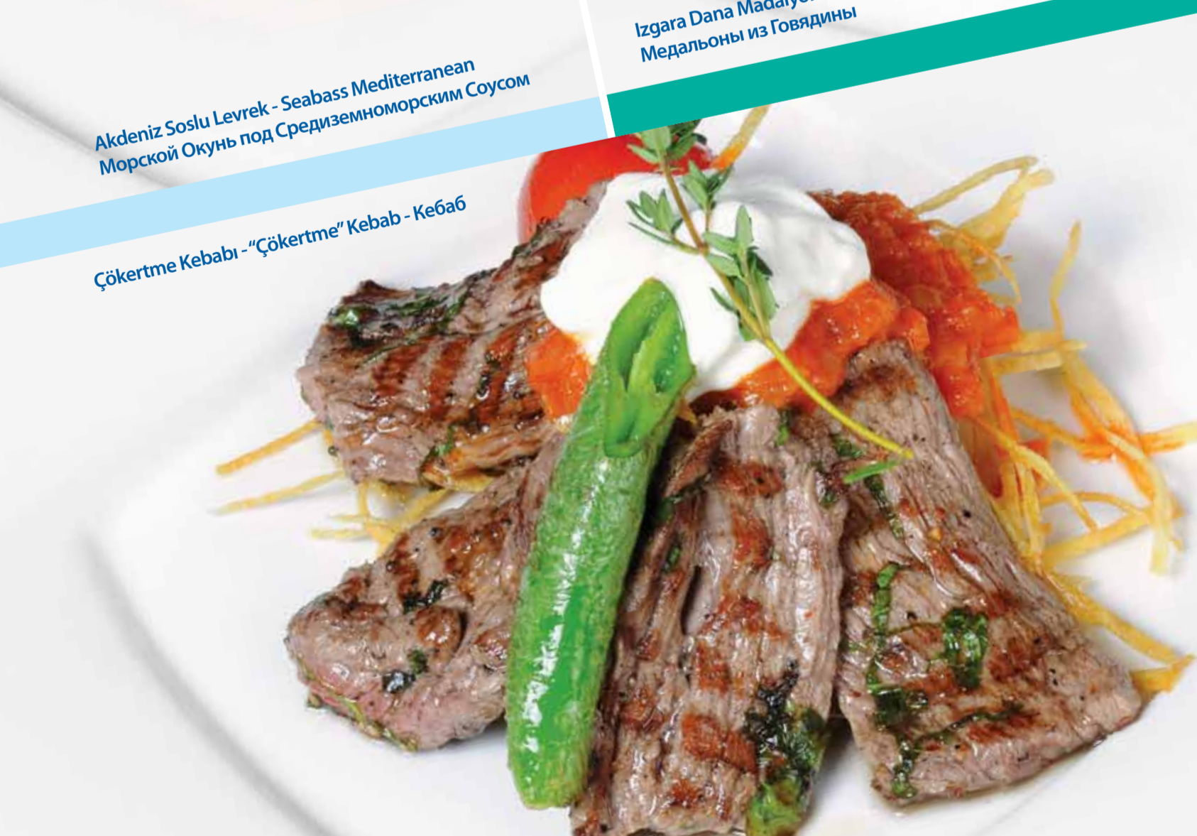
Çökertme Kebabı - "Çökertme" Kebab - Кебаб