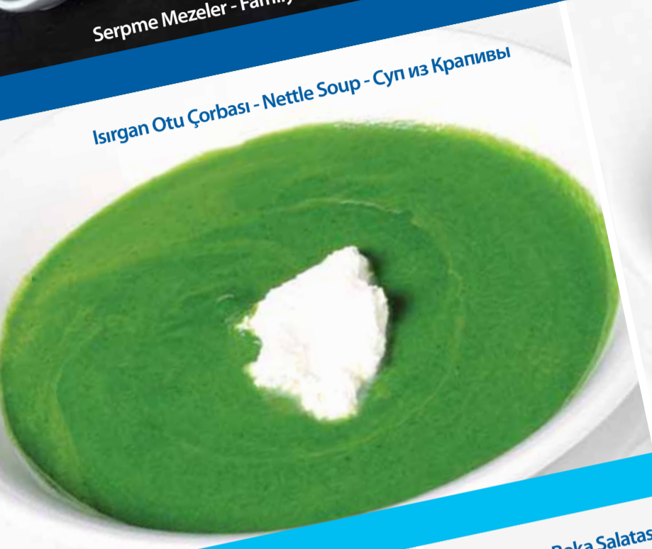
Isırgan Otu Çorbası - Nettle Soup - Суп из Крапивы