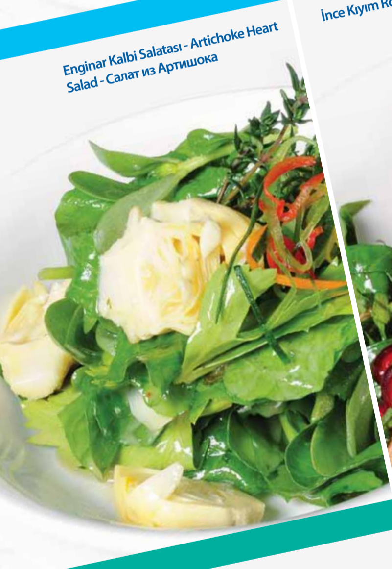
Enginar Kalbi Salatası - Artichoke Heart Salad - Салат из Артишока