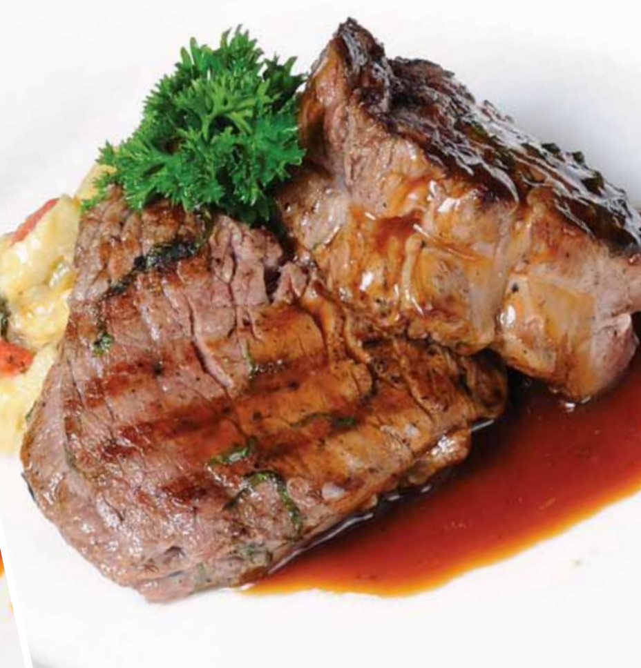
Izgara Dana Madalyon - Grilled Beef Medallions Медальоны из Говядины