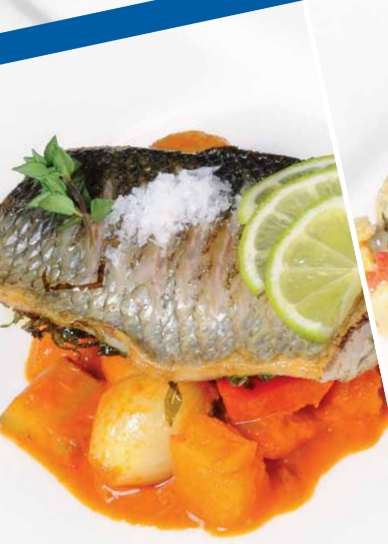
Akdeniz Soslu Levrek - Seabass Mediterranean Морской Окунь под Средиземноморским Соусом