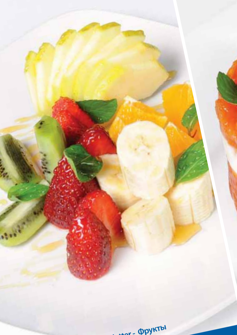
Meyve Tabagı - Fruit Platter - Фрукты