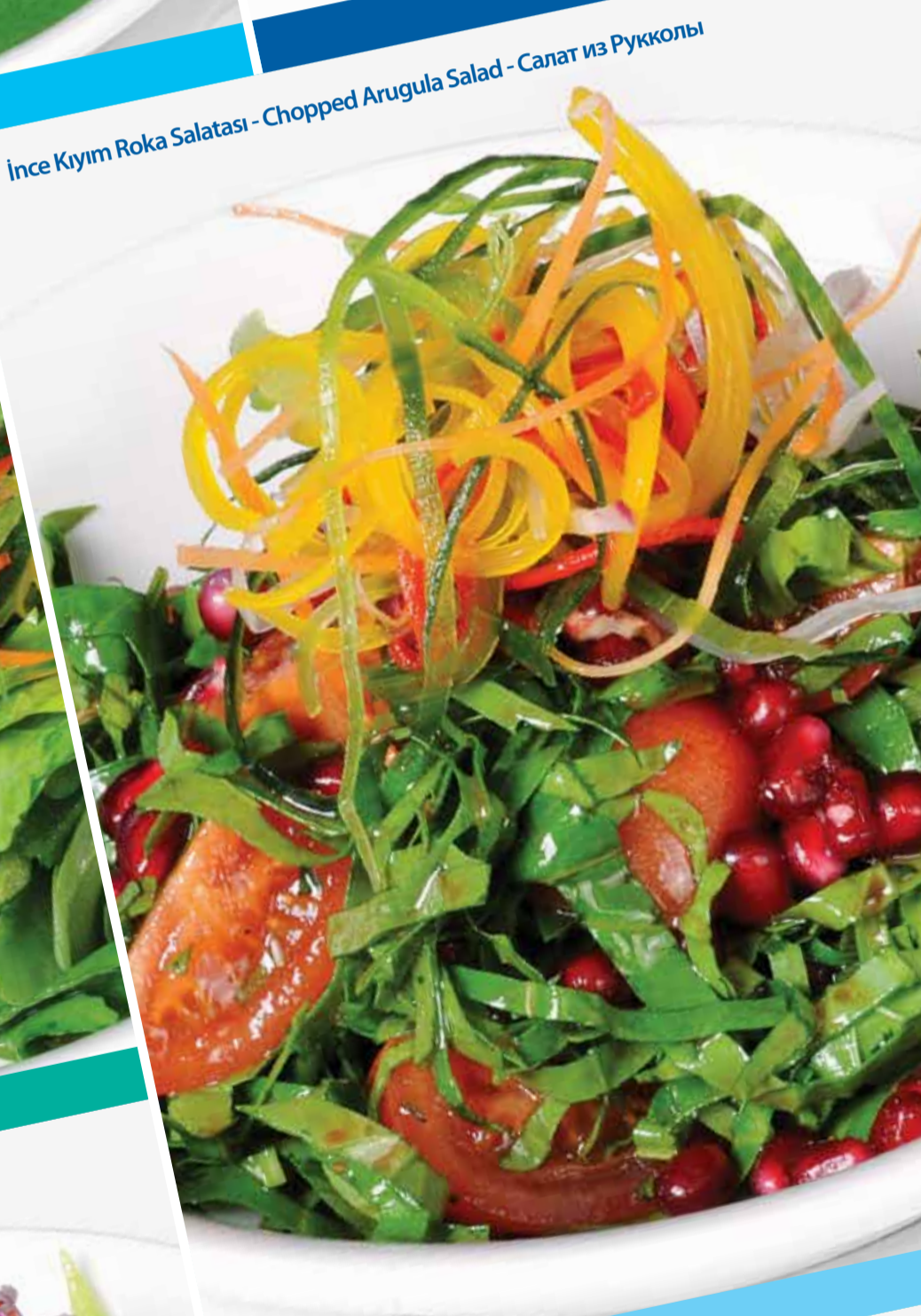
İnce Kıym Roka Salatası - Chopped Arugula Salad - Салат из Рукколы