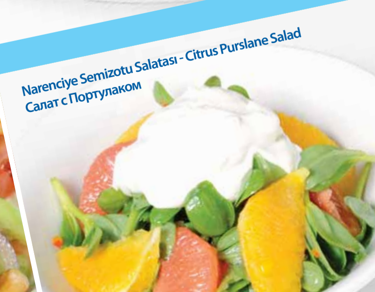
Narenciye Semizotu Salatası - Citrus Purlane Salad Салат с Портулаком