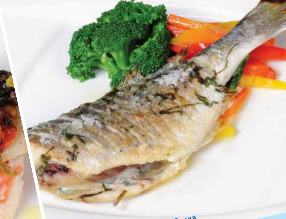
Tahinli Çipura - Royal Dorade - Грида