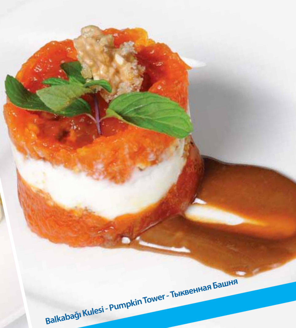
Balkabağı Kulesi - Pumpkin Tower - Тыквенная Башня