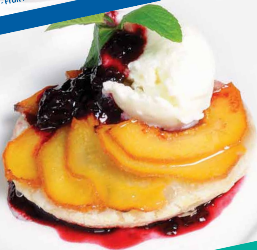
Ayva Tatin - Quince Apple - Турецкие Сладости из Айвы