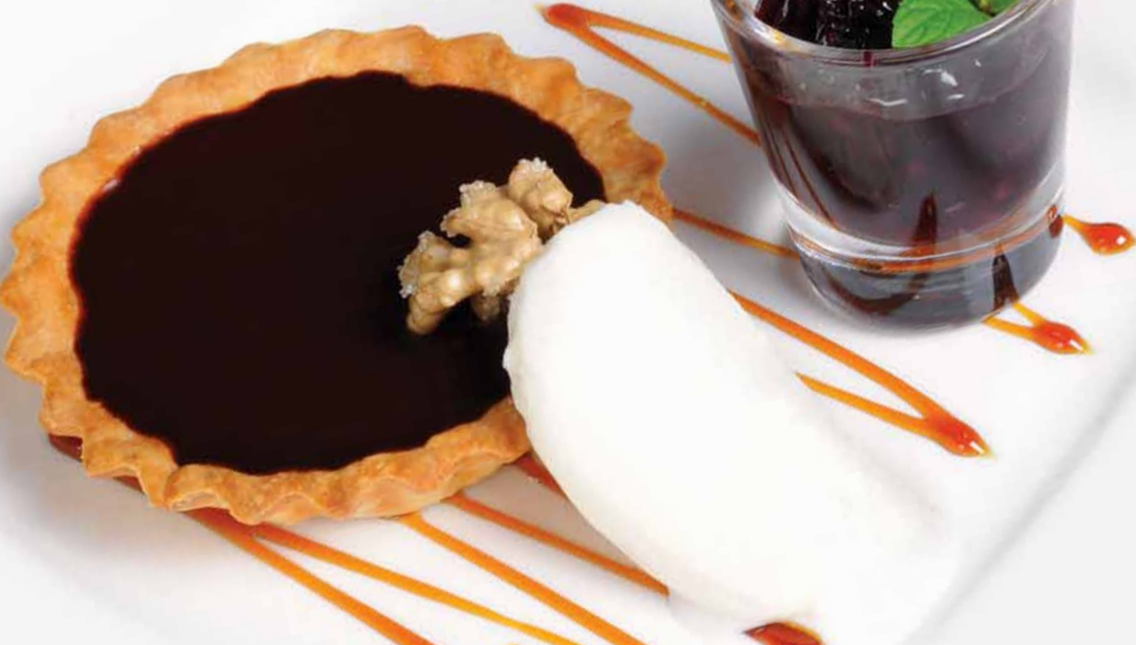
Trüflü Çikolata - Chocolate Truffle - Трюфельный Шоколад