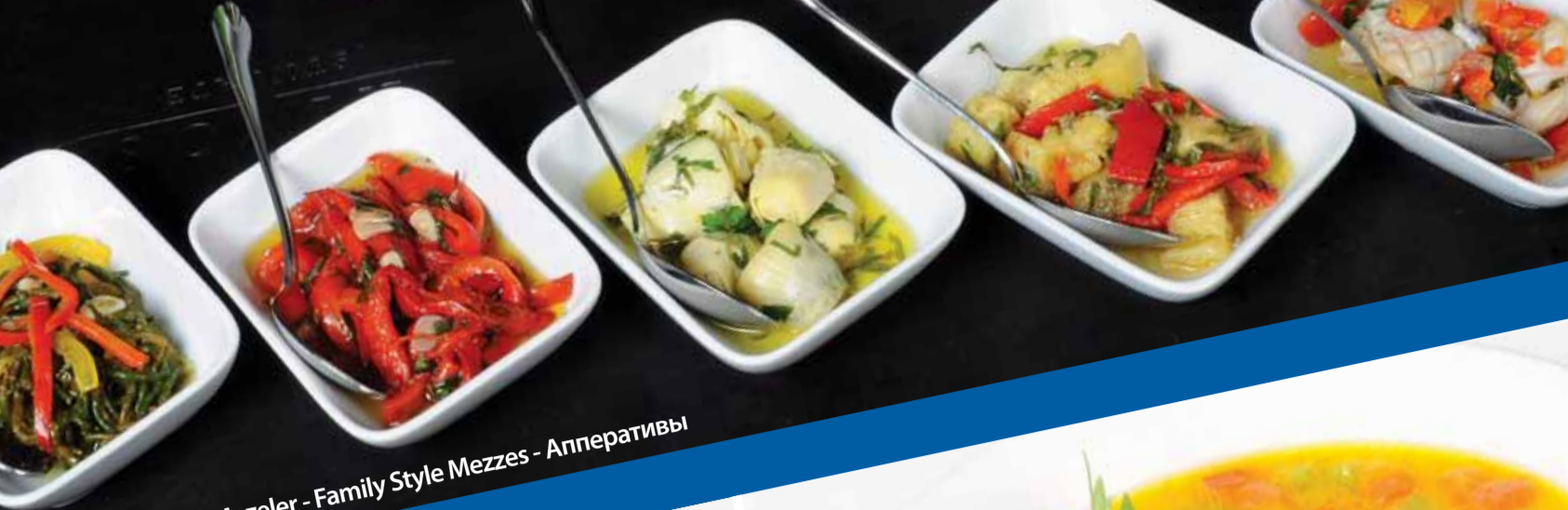
Serpme Mezeler - Family Style Mezzes - Апперативы