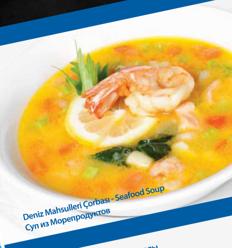
Deniz Mahsulleri Çorbası - Seafood Soup Суп из Морепродуктов