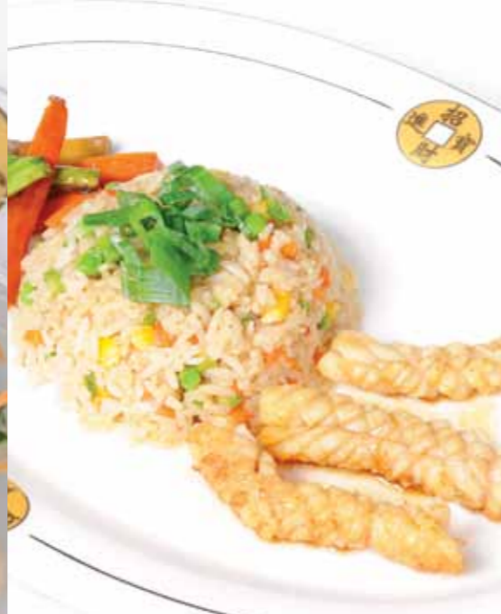
Kalamar Teppanyaki - Squid Teppanyaki