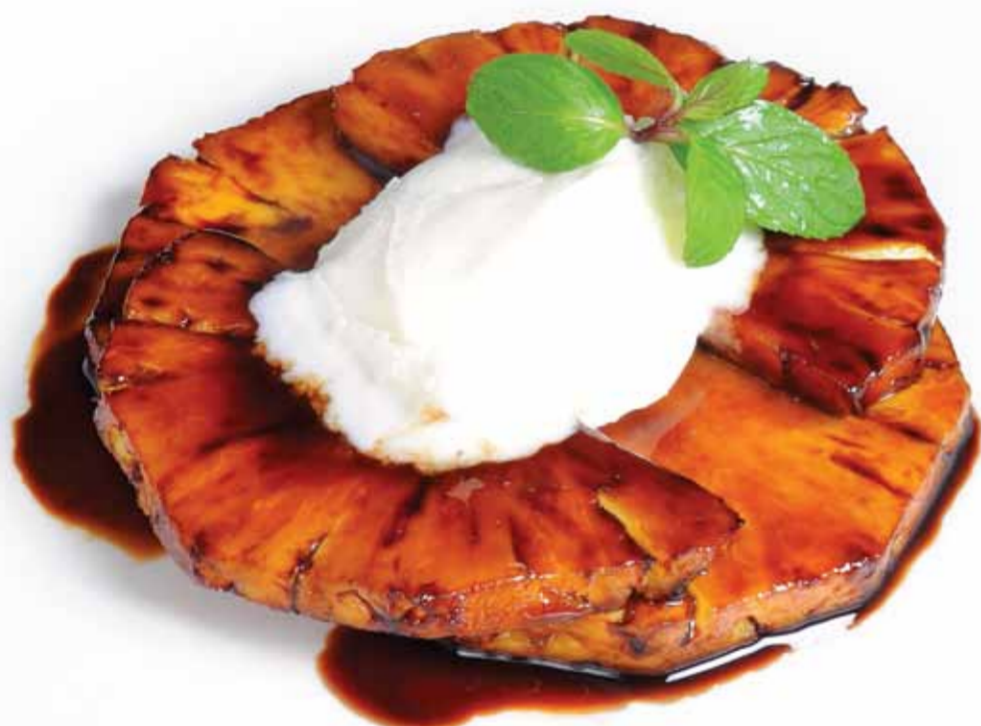
Ananas Teppanyaki - Pineapple Teppanyaki