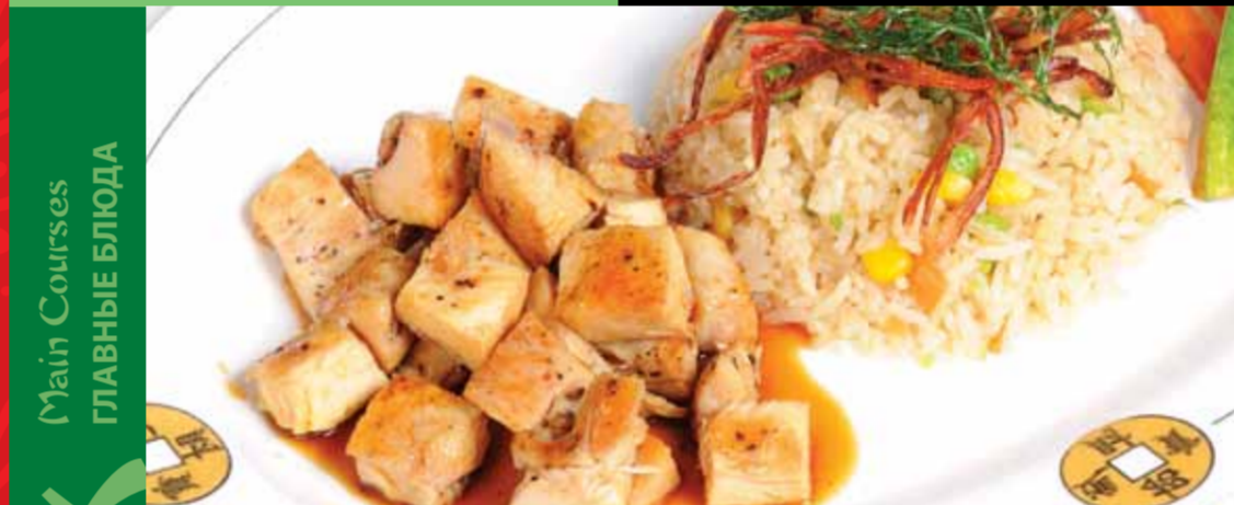
Tavuk Teppanyaki - Chicken Teppanyaki