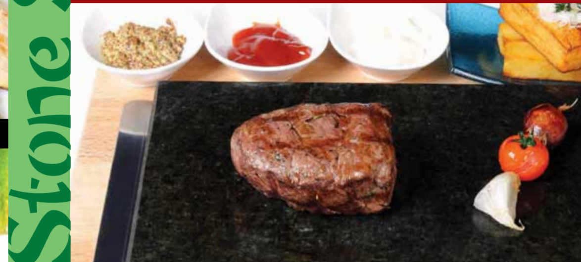
Lav Taşında Bonfile - Steak On Lava Stone