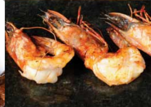
Lav Taşında Jumbo Karides Jumbo Prawns On Lava Stone