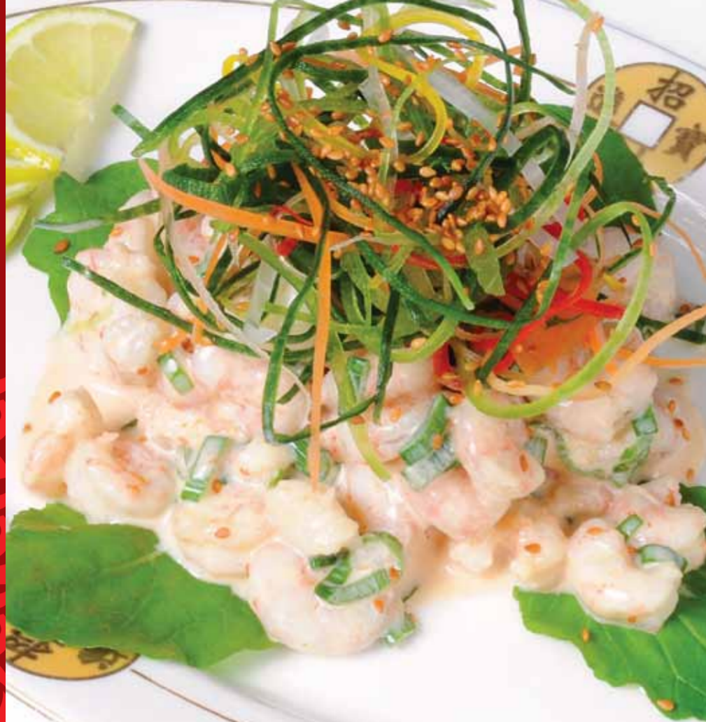
Çim Çim Karides Salatası - Shrimp Salad