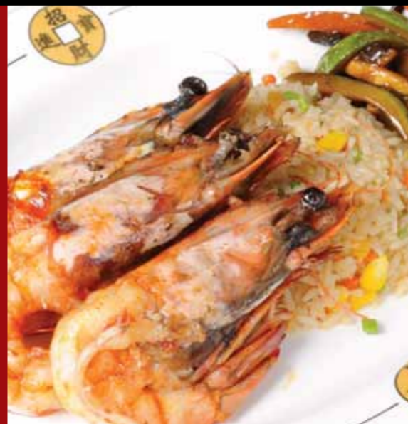
Karides Teppanyaki - Shrimp Teppanyaki