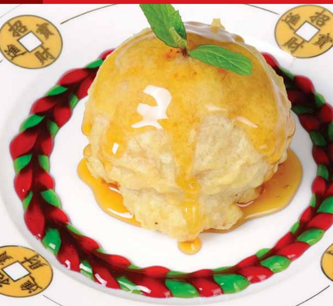
Japon Usulü Kızarmış Dondurma Japanese Style Fried Ice Cream