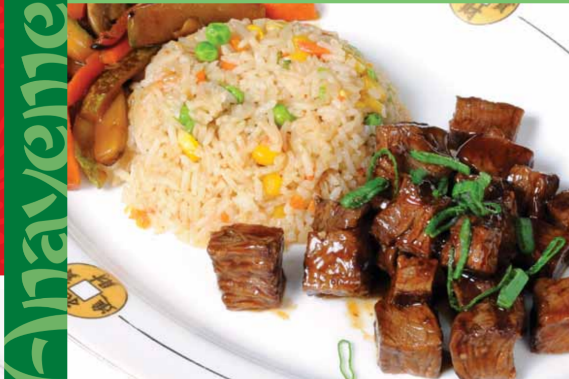
Bonfile Teppanyaki - Sirloin Steak Teppanyaki