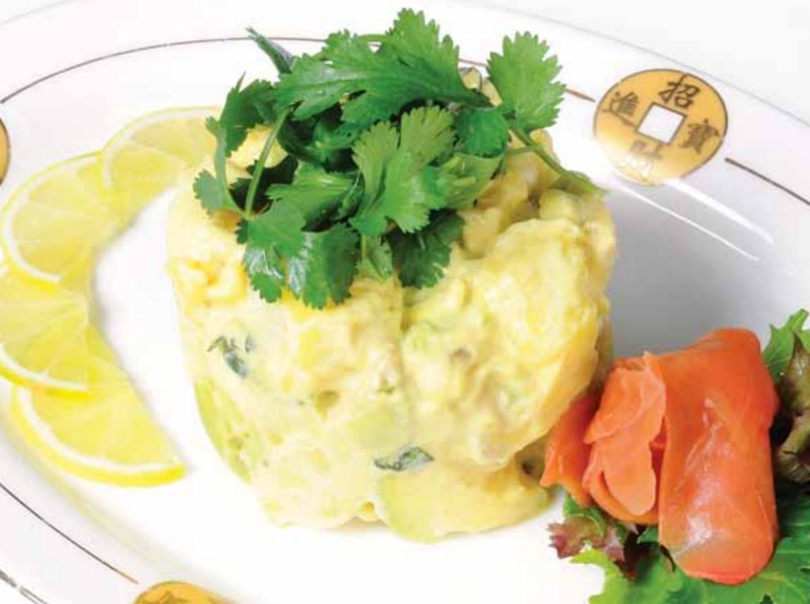
Avokado Salatası - Avocado Salad