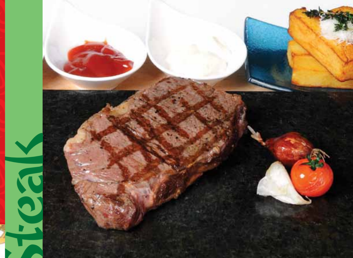
Lav Taşında Dana Antrikot - Entrecote On Lava Stone