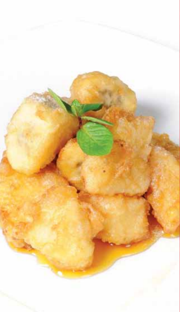
Kızarmış Meyveler - Fried Fruit