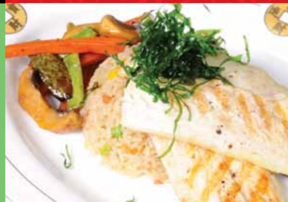
Levrek Teppanyaki - Seabass Teppanyaki

Овощи, Рис с Яйцами и Овощами, Специальный Соус на Гарнир