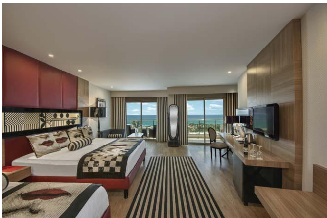
Джуниор сьют номер

Connection Room: 43 номеров, 2 x 35 м 2 , состоит из 2 номеров повышенной комфортности. В каждой комнате есть 1 двуспальная кровать, 1 односпальная кровать и 1 софа. В номерах есть центральный кондиционер (в определенные часы), душ / WC, фен, телефон, LCD телевизор со спутниковой антенной, сейф, мини бар, ламинированный пол, электрический чайник (набор чая и кофе). Ежедневно: уборка номера, смена полотенец. Смена белья - три раза в неделю. Номер с балконом, с видом на море. (Вместимость номера: в каждом номере 3 взрослых + 1 ребенок, 2 взрослых + 2 ребенка.) (Sofa Bed: 165x75 cm).