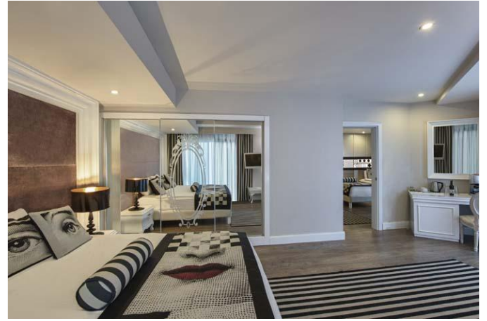
Делюкс Семейный номер

Делюкс Семейный номер: 9 номеров, 56 м2. Каждый номер состоит из двух спален, есть межкомнатная дверь. В одной спальне - 1 двуспальная кровать, в другой - 2 односпальные кровати. В номере 1 душ/WC, фен, телефон, LCD телевизор со спутниковой антенной, 1 мини-бар, сейф, ламинированный пол, центральный кондиционер (в определенные часы), электрический чайник (набор чая и кофе), кофе машина. Джакузи в террасе. Ежедневно: уборка номера, смена полотенец. Смена белья - три раза в неделю. Номер с видом на море (Вместимость номера: 4 взрослых + 1 ребенок или 3 взрослых + 2 ребенок).