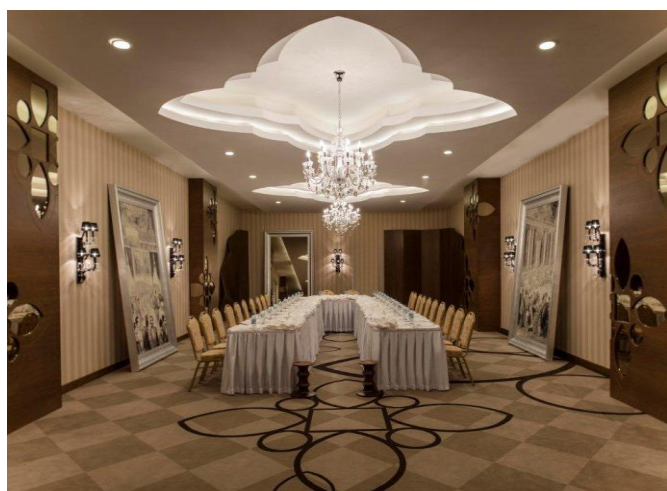
U - стол