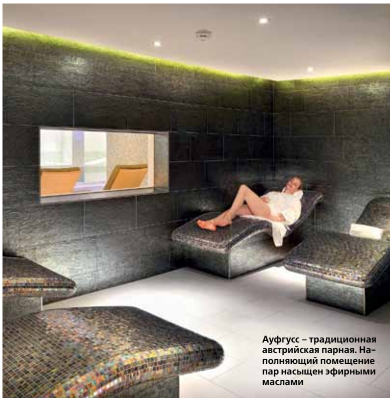
Ауфгусс – традиционная австрийская парная. Наполняющий помещение пар насыщен эфирными маслами

Гордость La Pura – отделение гендерной медицины, в основе которой лежит простой принцип: женщины устроены иначе. Поэтому, например, программы похудения и детокса здесь ориентированы исключительно на слабый пол. Ну а главное, это, конечно, возможность неделю или две посвятить себе любимой. Завидуйте, мужчины! ☘