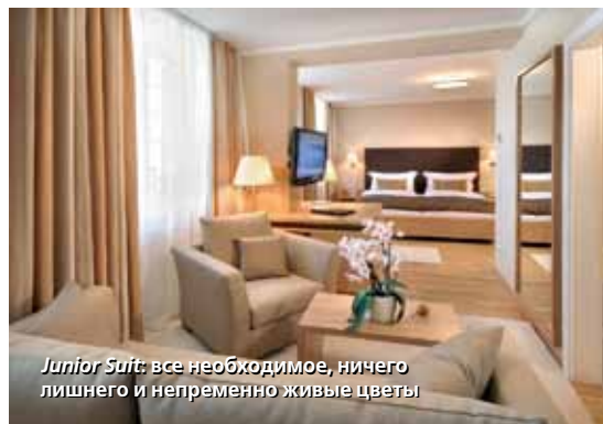
Junior Suit : все необходимое, ничего лишнего и непременно живые цветы