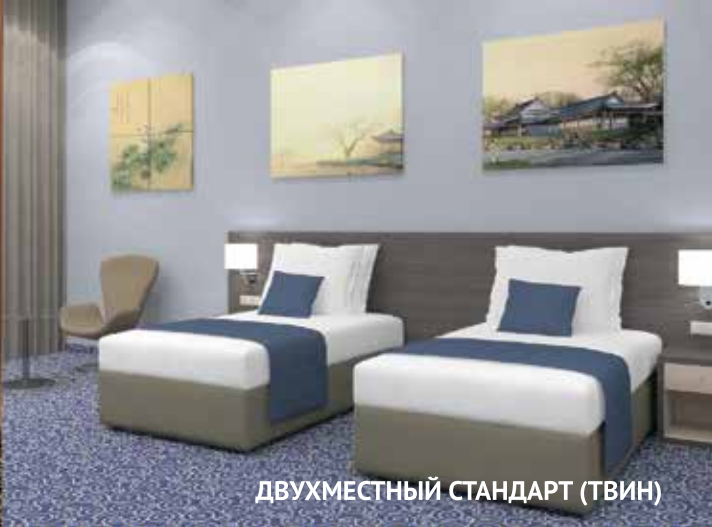
ДВУХМЕСТНЫЙ СТАНДАРТ (ТВИН)