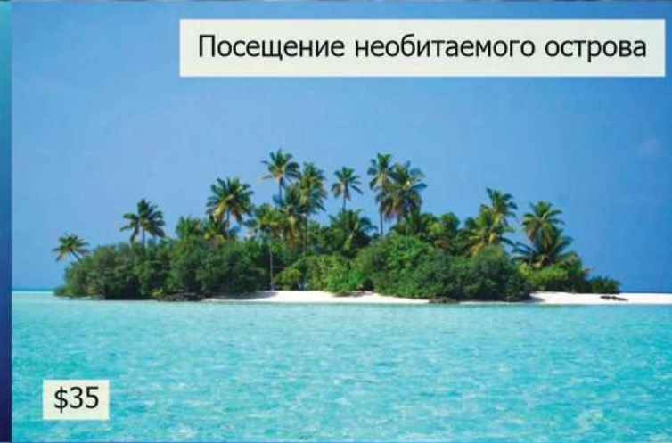
Посещение необитаемого острова