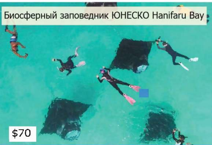
Биосферный заповедник ЮНЕСКО Hanifaru Bay