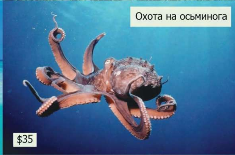
Охота на осьминога