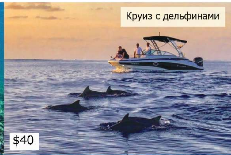
Круиз с дельфинами