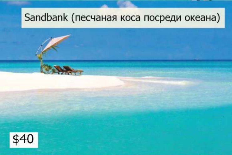
Sandbank (песчаная коса посреди океана)