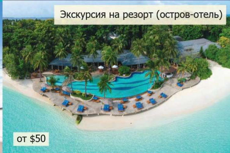
Экскурсия на резорт (остров-отель)